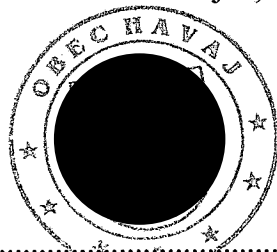
..... odtlačok pečiatky prevádzkovateľa

Obec Havaj so sídlom Havaj 13, 090 23 Havaj ako prevádzkovateľ vyhlasuje, že spoločnosť PP PROTECT s.r.o., spĺňa predpoklady podľa čl. 37 ods. 5 nariadenia Európskeho parlamentu a rady (EÚ) 2016/679 o ochrane fyzických osôb pri spracúvaní osobných údajov a o voľnom pohybe takýchto údajov, ktorým sa zrušuje smernica 95/46/ES (Všeobecné nariadenie o ochrane údajov) na výkon funkcie zodpovednej osoby.